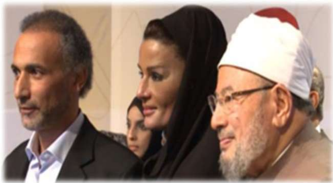
Tareq Ramadan, Cheikha Moza et Youssef Al Qaradawi lors de l'inauguration du CILE - Doha, le : 15 janvier 2012